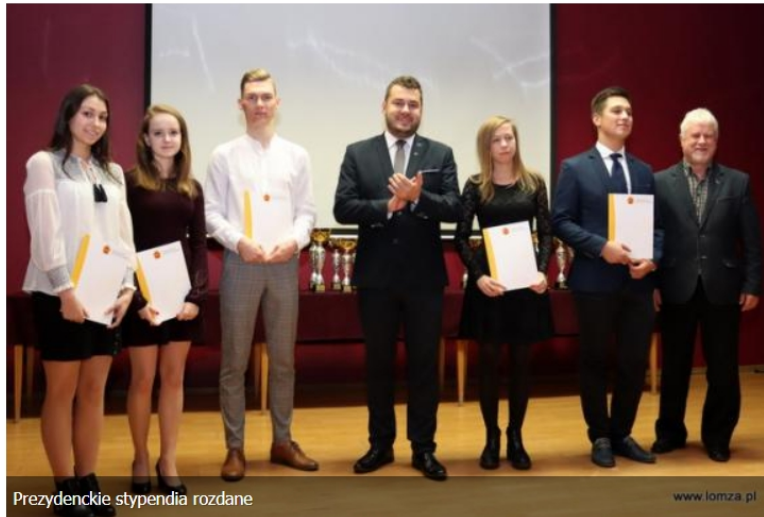
Prezydenckie stypendia rozdane